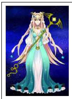
4人の守護神のうちの1人、 東の守護神イース