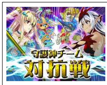
4人の守護神の下、育てた コスモで町の覇権を奪え！！