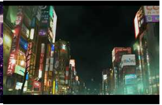
夜に浮かぶ美しい街並み