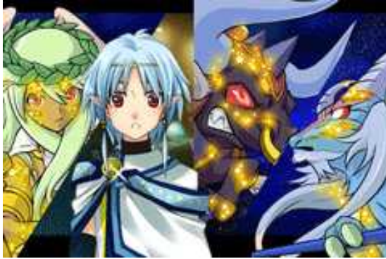
失われた女神の魂を探すストーリー 登場人物は魅力的

「星屑の大戦 コスモマキアー by GMO」の最大の特徴は、なんといっても魅力的な登場人物、88 星座をモチーフにした多彩なキャラクターたちが織りなすドラマティックなストーリーです。遊び方は、ストーリーに沿って進み、敵とのバトルも自動で進行するので至って簡単。誰でも気軽にゲームを楽しむことができます。