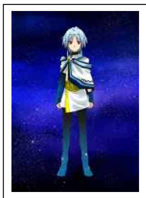
プレイヤーを導く 謎の少年、オステル

そう告げられ、あなたはオステルに導かれるまま、荒ぶる星「カオス」と輝く星「コスモ」をめぐる、夜の東京を舞台にした壮大な星たちの物語へと足を踏み入れる……。