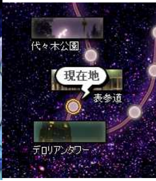
夜の東京が冒険の舞台