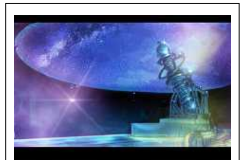
「コスモ」のレベルアップや合成、 入手はすべてここで行う

合成 : 2 体の「コスモ」をプラネタリウムで「合成」し、生まれ変わった「コスモ」は新しいスキルを習得していきます！